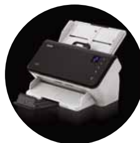
Scanners E1025 et E1035 d'Alaris

*La vitesse de débit dépend du logiciel d'application, du système d'exploitation, de l'ordinateur employés et des fonctions de traitement d'image sélectionnées.